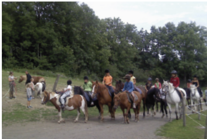
■ L'équitation est l'une des activités qui a rencontré le plus grand succès avec la sortie bateau à Garabit, et les grands jeux Koh Lanta et Fort Boyard.

S'il est une association qui a su travailler rapidement et efficacement, c'est bien l'association Familles Rurales du Canton de Pierrefort en mettant en place ce projet en un temps record grâce à l'aide de sa fédération de tutelle.